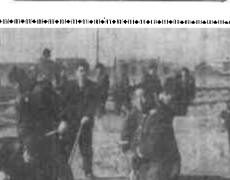
山东黄河三角洲国家级自然保护区管理局协办 电话：8332902